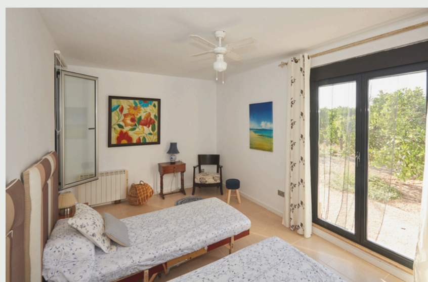
Chambre double/triple Chambre individuelle possible avec supplément, selon disponibilité.