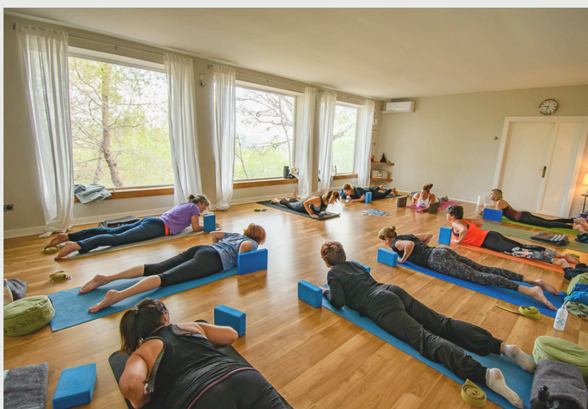
Shala intérieur avec une vue magnifique