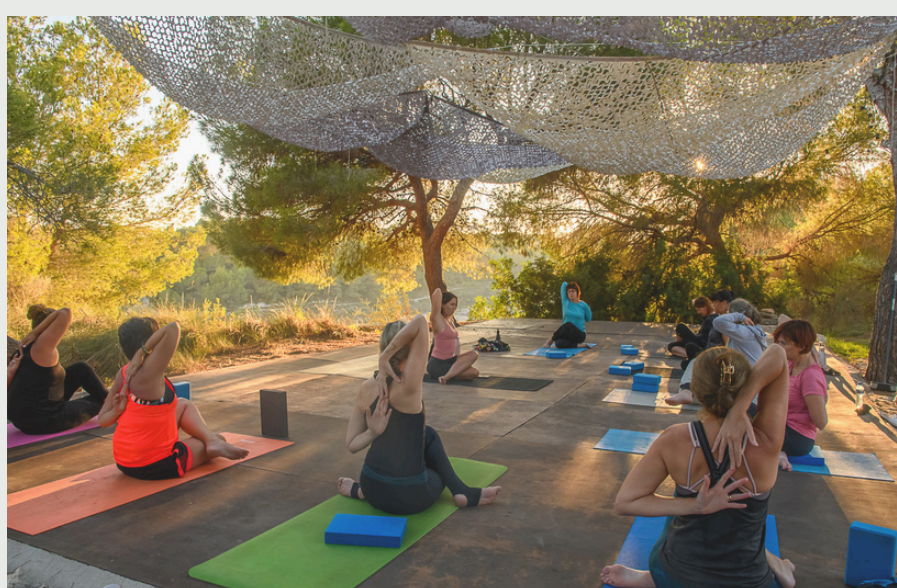
Shala extérieur entouré de pins